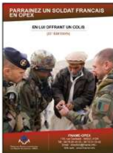
Dossier de presse

Pour soutenir, faire connaître et animer l'opération "un colis pour un soldat de la paix", vous avez à votre disposition :