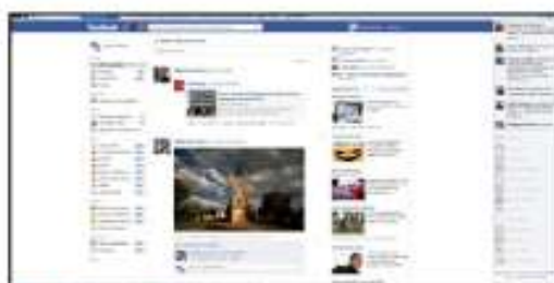
Facebook : www.facebook.com/fname.opex