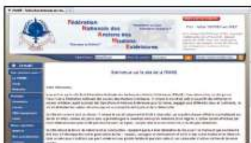
Site web : www.fname.info