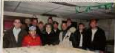
La Fname représente un soutien aux militaires en ces périodes de fêtes.

La Fédération nationale des anciens des unités combattantes (Fname) vient, pour la vingtième année consécutive, de lancer l'opération « Colis pour les militaires déployés par le monde ». C'est à la base logique de la Fname, à Châteauneuf, que les adhérents se sont retrouvés pour constituer plus de 500 colis, composés exclusivement de produits organiques. Ces colis sont destinés au 21 RMAA (régiment de parachutistes d'élite) mar (les 843) à Trévis, au 1 er régiment Spéciale (unité de l'armée française relevant de l'armée blindée cavalerie, 843) à Wiktor