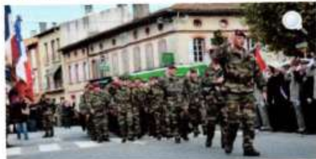
Le 1er RCP à l'occasion de la cérémonie de dissolution du battle group de retour d'Afghanistan.

Afin de soutenir les militaires français déployés sur les théâtres d'opérations à l'étranger, la fédération nationale des anciens des missions extérieures (FNAME), réitère son