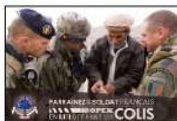
Carte de parrainage