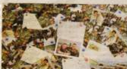
La Fédération nationale des anciens des unités combattantes (Fname) réalise l'opération « Colis » pour la 20 e année de suite.

Pour la 20 e année, une Opération Colis est organisée au profit de soldats français engagés sur des théâtres d'opérations extérieures.